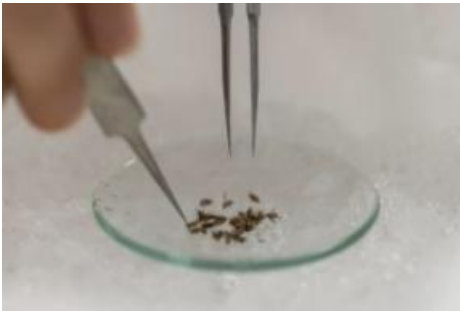
Photo Report on the Interference Between Viruses and Transposable Elements