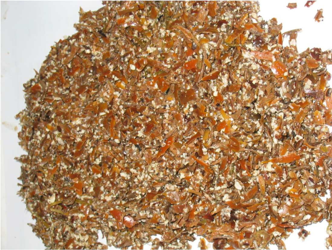
Contenu stomacal représentatif de la consommation de fruits forestiers par un sanglier.