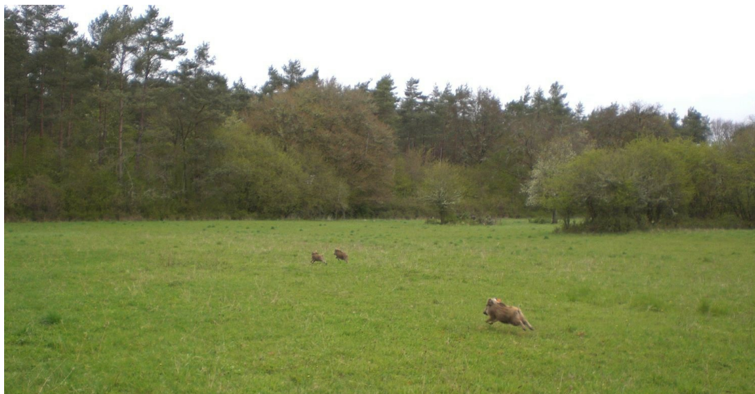
Relâcher de marcassins après capture.