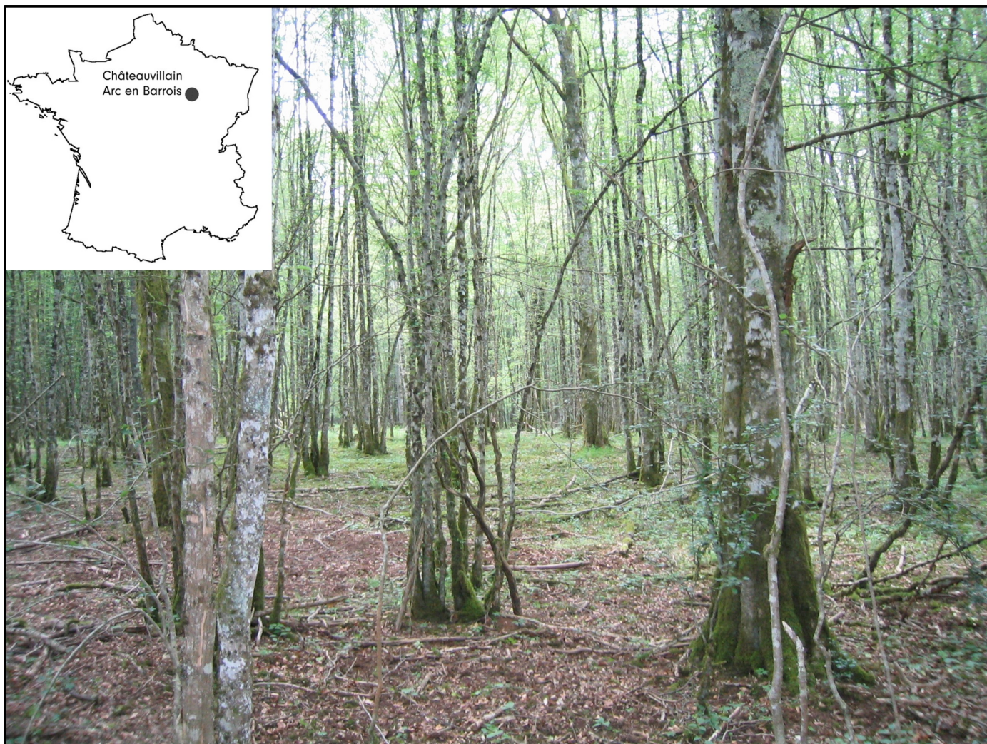
Site d'étude d'Arc-en-Barrois-Châteauvillain.

Historiquement, le site d'étude sur lequel le plus de travaux ont été conduits est localisé dans le massif de Châteauvillain-Arc-en-Barrois (Haute-Marne, France), aujourd'hui situé au cœur du Parc National des Forêts de Bourgogne et Champagne. La forêt domaniale d'Arc-en-Barrois-Châteauvillain (11 000 hectares) abrite l'un des plus anciens massifs forestiers de France, datant de la Révolution Française. Depuis 2021, elle a été classée Réserve Intégrale. Le climat est intermédiaire, entre continental et océanique. Cette forêt est constituée de feuillus de plaine, principalement de chênes (41%) et de hêtres (30%), essences dont les fruits constituent une ressource alimentaire importante pour les sangliers. L'effectif de la population de sangliers sur ce site a été estimée à 1 200 -1 500 individus. Ce site bénéficie du label CNRS « suivi à long-terme du vivant ». D'autres populations de sangliers sont également suivies et étudiées au LBBE en collaboration avec nos partenaires de l'OFB, notamment la population de Chizé (Deux-Sèvres, France) et de La Petite Pierre (Bas-Rhin, France), ainsi que la population de Belval-Bois-des-Dames (Ardennes, France) avec nos partenaires de la Fondation François Sommer.