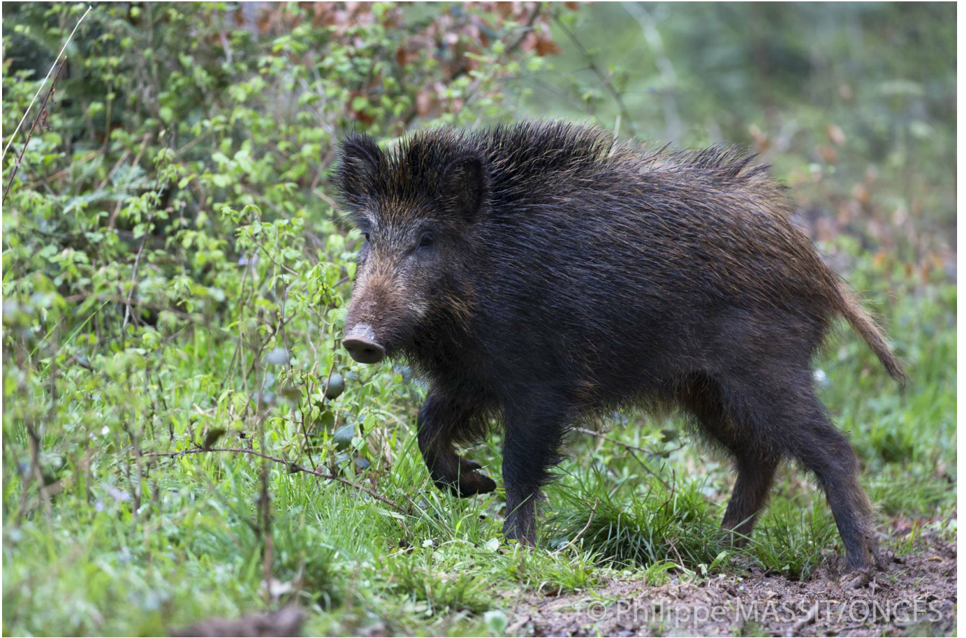
Sanglier sub-adulte.