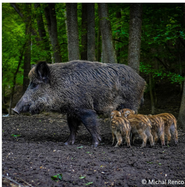
Fiche d'identité du sanglier.

Régime : omnivore (fruits forestiers, lombrics, herbe, etc.)