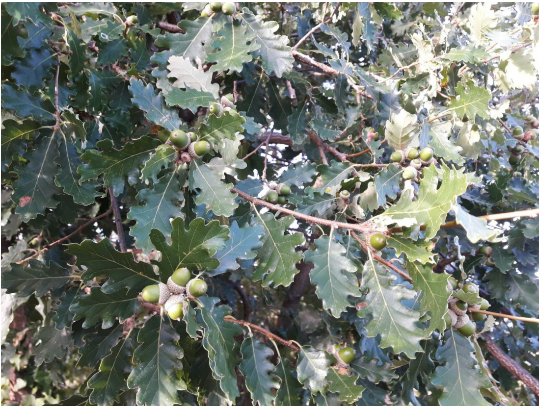
Les glands de chênes constituent une ressource alimentaire de choix pour le sanglier.